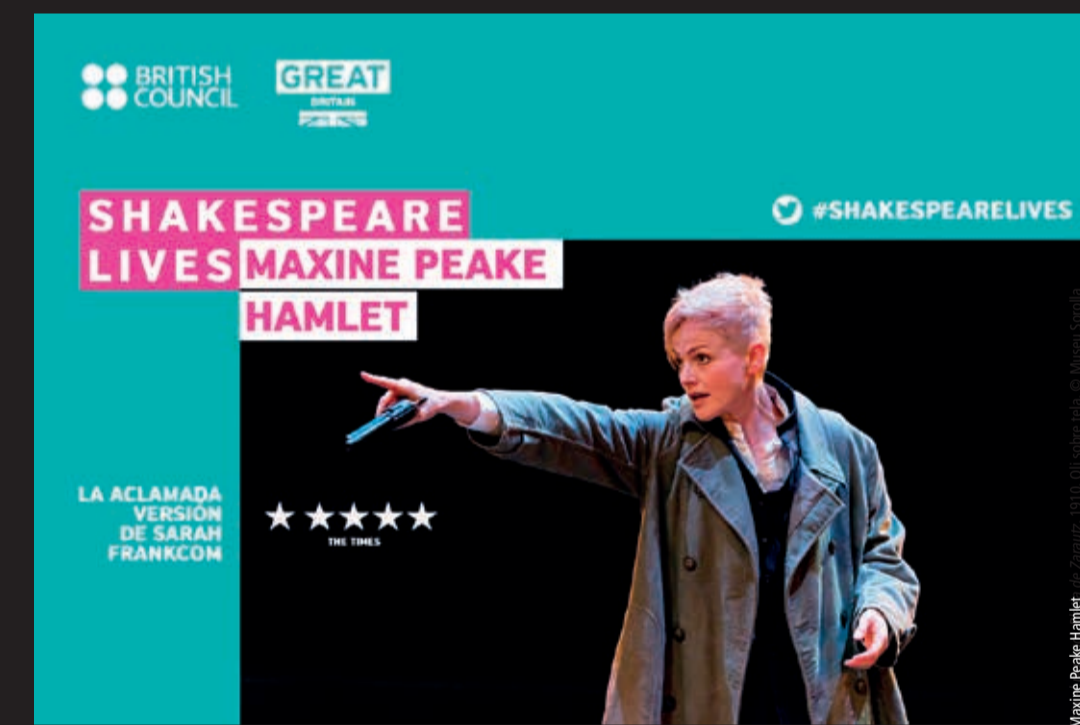
Maxine Peake Hamlet