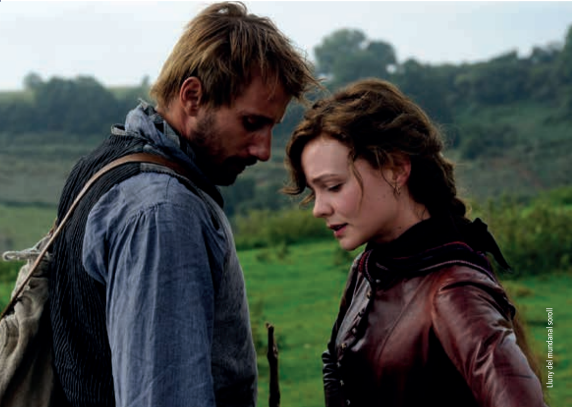
Lluny del mundanal soroll

Info + entrades, a CaixaForum.com/agenda