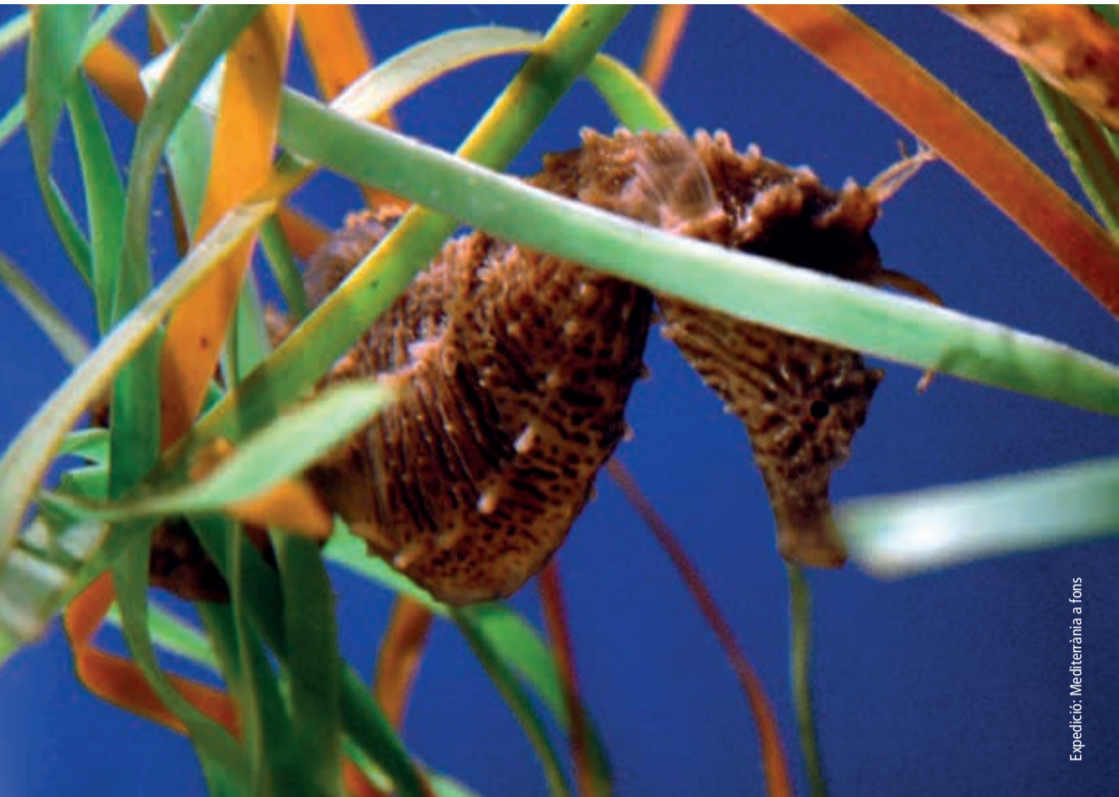
Expedició: Mediterrània a fons